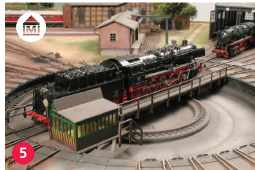
5 Galleria Baumgartner galleriabaumgartner.ch