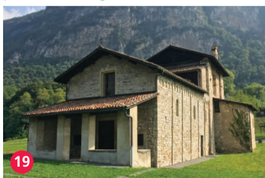
19 Chiesa di San Martino