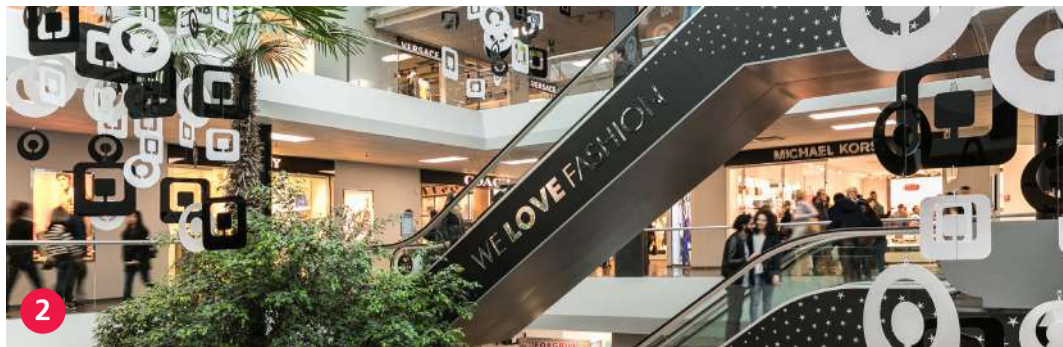
2 FoxTown Factory Stores - Infopoint Mendrisiotta Turismo foxtown.com