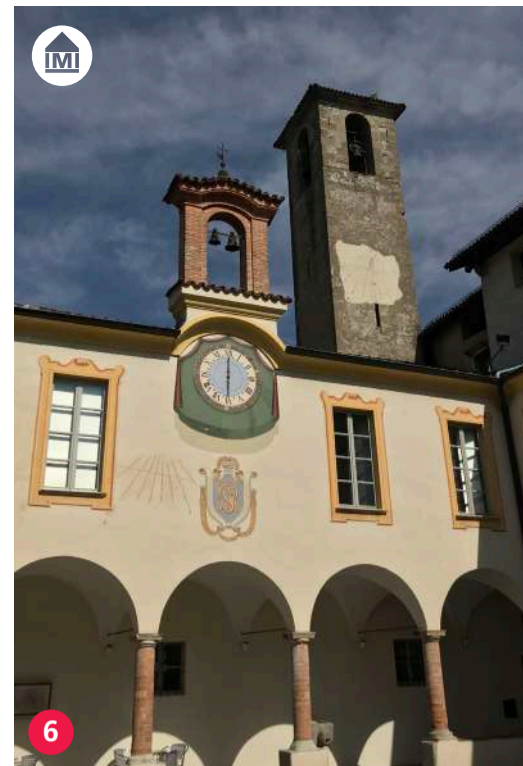
6 Museo d'arte Mendrisio museo.mendrisio.ch