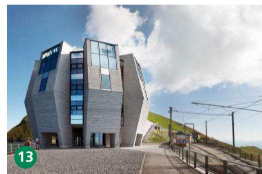
13 Fiore di pietra, Arch. Mario Botta montegeneroso.ch