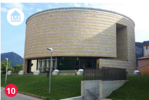
10 Teatro dell'architettura, Arch. Mario Botta