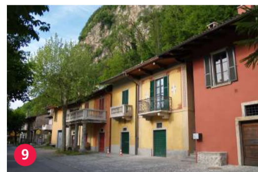
9 Cantine di Mendrisio