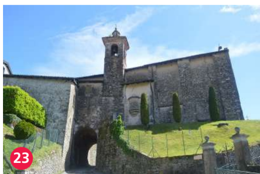
23 Chiesa di San Sisino