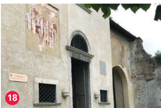
18 Oratorio della Madonna delle Grazie