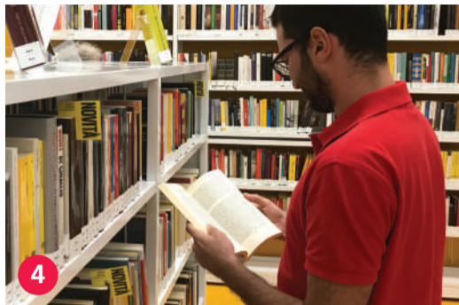
4 La filanda lafilanda.ch