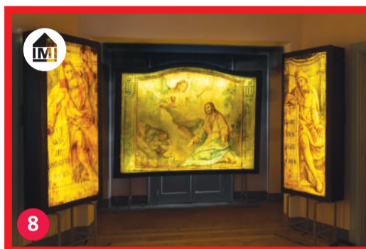
8 Museo del trasparente museo.mendrisio.ch