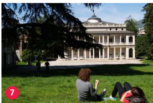
7 Villa Argentina e parco botanico