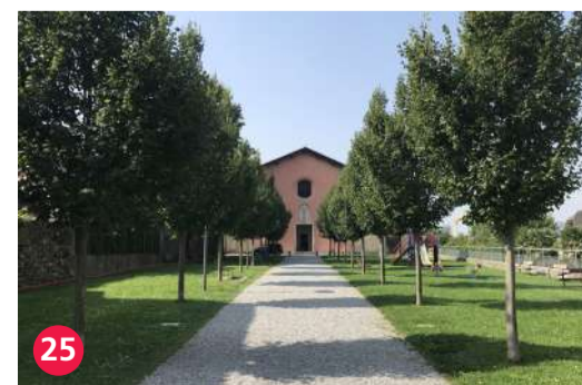
25 Chiesa dei Cappuccini

8: Processioni della Settimana Santa di Mendrisio, Representative List of the Intangible Cultural Heritage of Humanity (UNESCO) 14: Monte San Giorgio UNESCO WHL