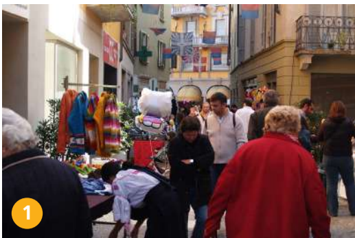
1 Nucleo Storico