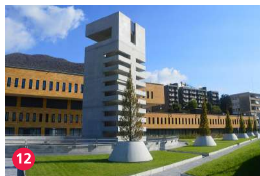
12 Centro Pronto Intervento, Arch. Mario Botta