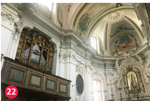
22 Chiesa di San Giovanni