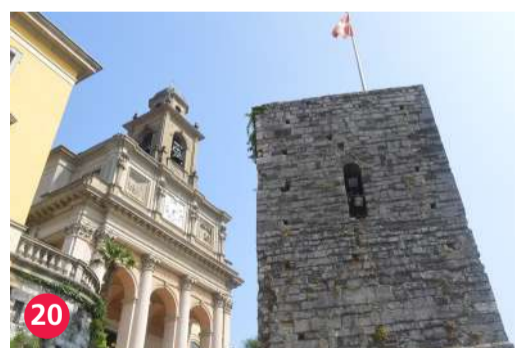
20 Chiesa dei Santi Cosma e Damiano