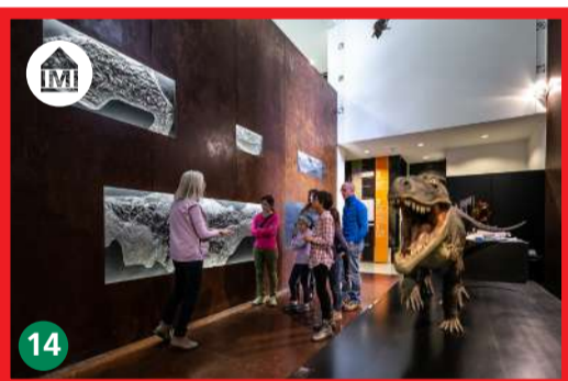
14 Monte San Giorgio, Arch. Mario Botta montesangiorgio.org