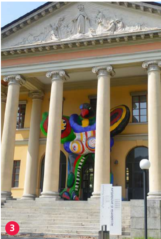
3 Accademia di Architettura arc.usi.ch