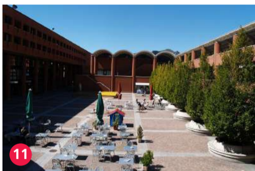
11 Piazzale alla Valle, Arch. Mario Botta