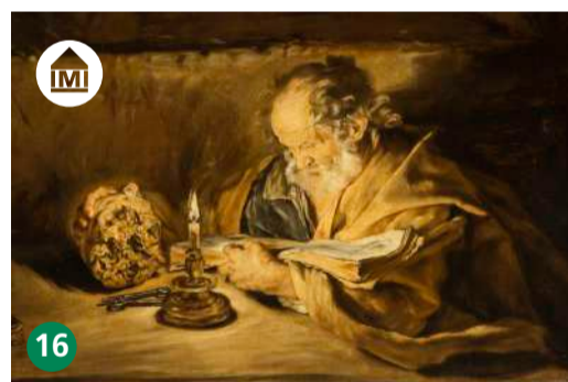
16 Pinacoteca Züst Rancate ti.ch/zuest