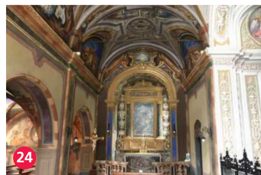
24 Chiesa di Santa Maria in Borgo