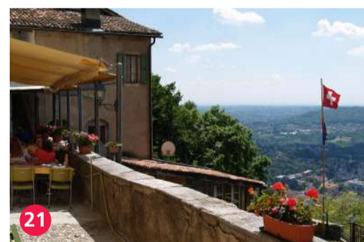
21 Eremo di San Nicolao