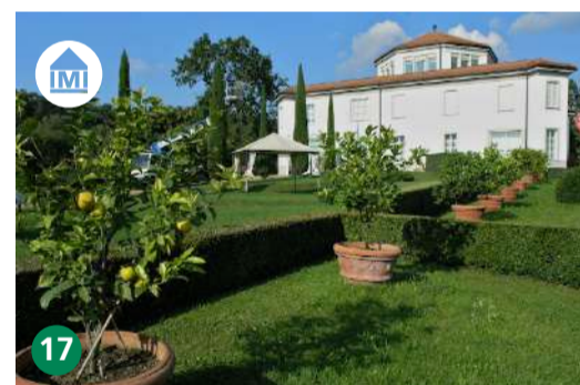
17 Museo Vincenzo Vela Ligornetto museo-vela.ch