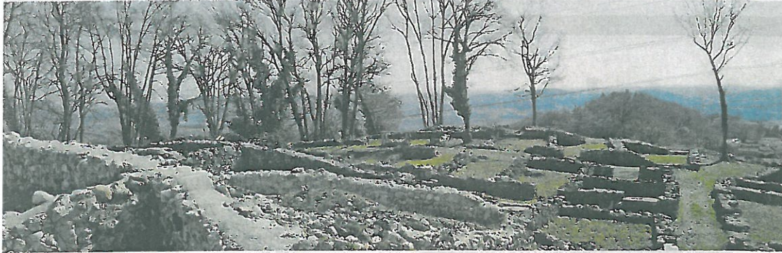
A COLLINA Una parte delle mura messe in luce dagli scavi di questi anni e, a destra, una volontaria al lavoro nel sito.