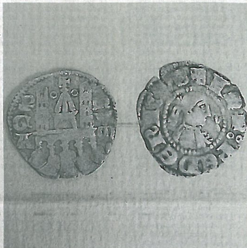
UN PICCOLO TESORO Nel sito archeologico sono state trovate molte monete, come questo mezzo denaro di Bergamo.

Quindici anni fa il villaggio era ricoperto dai boschi