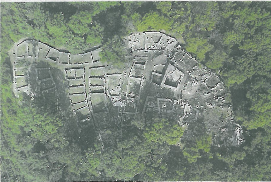
CINQUANTA EDIFICI Una veduta dall'alto del sito archeologico della collina Castello di Tremona.

Il premio Lavezzari ai volontari che dal 2000 lavorano nel sito archeologico momò. Sotto la terra c'era un insediamento di contadini con tante inspiegabili anomalie